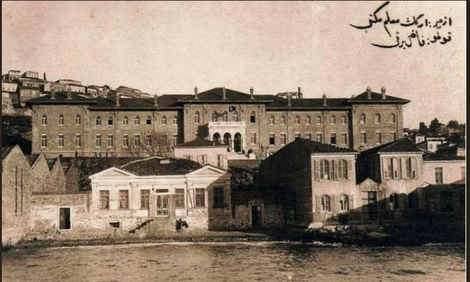
• Το κτίριο του Πανεπιστημίου Σμύρνης